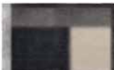
18 LANDFIELD "ECLIPSE" TAPPETO CM 500X300