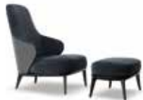
6-7 LESLIE BERGÈRE CM 68X94 H100 POGGIAPIEDI CM 61X45 H34